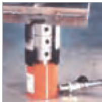
Illustration de blocs de soutènement avec un vérin RSS302 « court » de 30 tonnes. Pour toute information complémentaire, voir page 40.